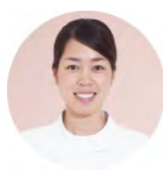
Staff N / はなみずき歯科医院 勤務11年目 ※産休中

私の経歴は少し変わっています。医院の受付として働くなかで、歯科衛生士を目指す気持ちが芽生 えて資格を取得。働くことと学ぶこと、両方を叶える環境をいただきました。現在は産休中。変化 する人生の今、大切にしたいことに安心して向き合うことができます。