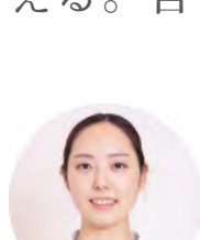
Staff T / はなみずき歯科医院 勤務1年目

新卒で四年半働いた他の医院から転職を決めた一番の理由は、人と人との和やかな空気、気兼ねの ない対話と人柄です。共感も返答もしっかりと言葉で、忙しくても評価を添えて背中を押してもら える。自信を持って診療に向かえる環境は、私が探していたものでした。