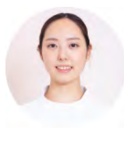
Staff T / はなみずき歯科医院 勤務2年目

新卒で四年半働いた他の医院から転職を決めた一番の理由は、人と人との和やかな空気、気兼ねの ない対話と人柄です。共感も返答もしっかりと言葉で、忙しくても評価を添えて背中を押してもら える。自信を持って診療に向かえる環境は、私が探していたものでした。