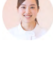
Staff U / はなみずき歯科医院 勤務6年目

最初は正直負いもありましたが、セミナー参加を重ねる度に技術の向上を実感。自分の強み、何 かに特化したプロでいたいという願いと自信が膨らんでいます。2023年の東京のセミナーでは有給 を組み合わせる観光を楽しんだり、特別な経験に感謝しています。