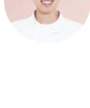
Staff N / はなみずき歯科医院 勤務12年目 ※産休中

私の経歴は少し変わっています。医院の受付として働くなかで、歯科衛生士を目指す気持ちが芽生 えて資格を取得。働くことと学ぶこと、両方を叶える環境をいただきました。現在は産休中。変化 する人生の今、大切にしたいことに安心して向き合うことができている。